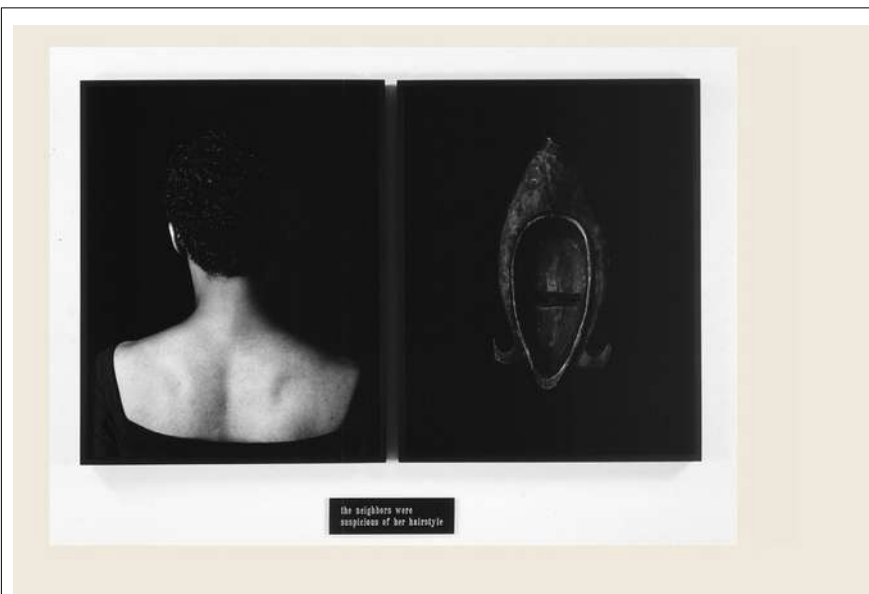
Lorna Simpson, Flipside , diptyque photographique, 130,8 X 177,8 cm, Guggenheim Museum, 1991.