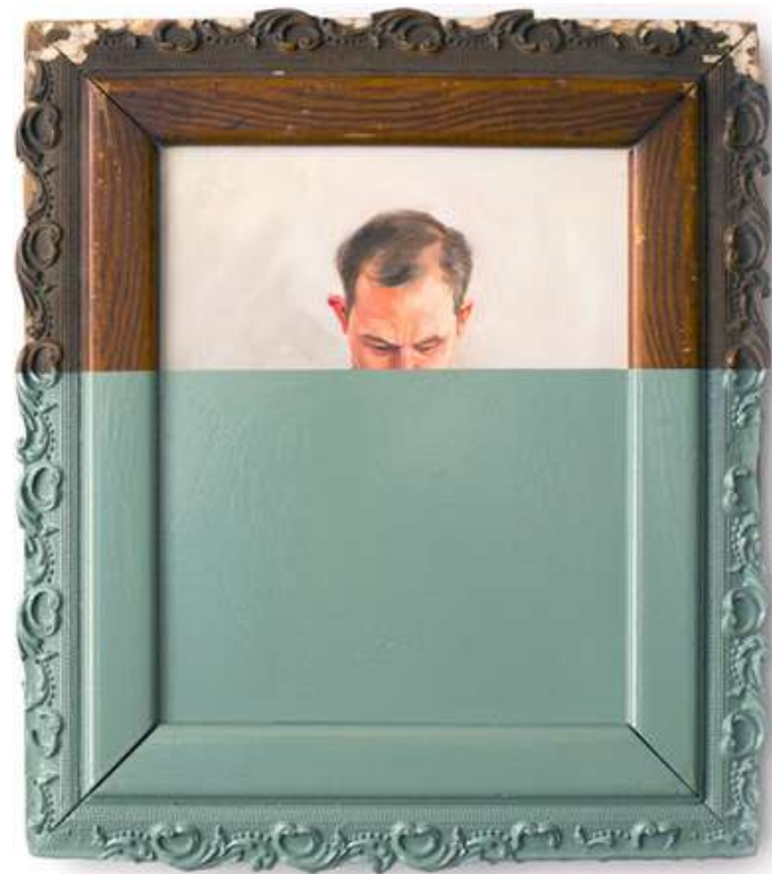
Oliver Jeffers, Dipped Paintings , huile sur toile et émail, 42 X 38 cm, 2015.