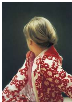
Gerhard Richter, Portrait de Betty , huile sur toile, 102 X 72 cm, St Louis Museum, 1988.