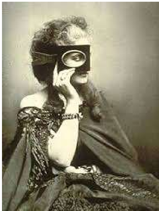
Pierre-Louis Pierson, Portrait de la Comtesse Castiglione , atelier Mayer et Pierson, 1860.