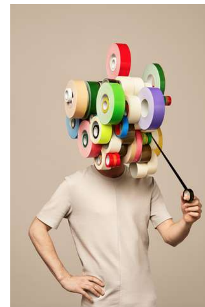
Akatre Studio, Visuel pour la carte adhérent au CGP, Centre Georges Pompidou, 2018.