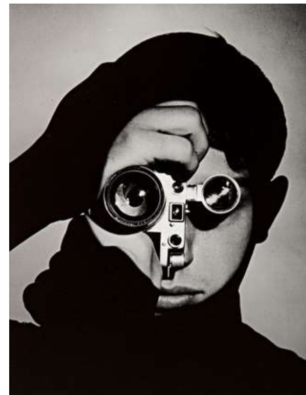
Andreas Fininger, The Photojournalist , photographie argentique, 1951.