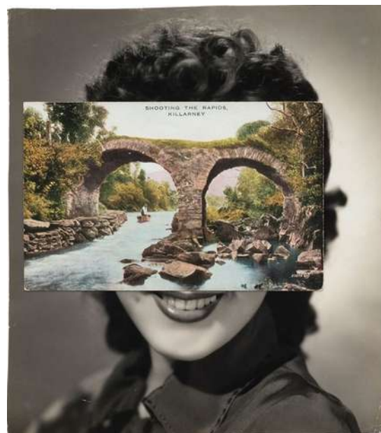
John Stezaker, Mask (film portrait collage), CLXXIII, collage, 20X17,6 cm, 2014.