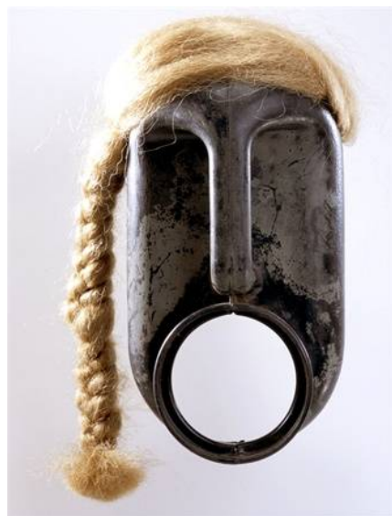
Artiste Béninois Romuald Hazoumé Série des masques bidons