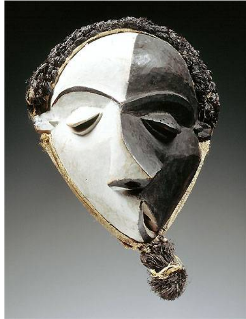
"Masque mbangu", Pende Centraux Bandundu méridional, Zaïre. Musée de Tervuren Bruxelles

Vocabulaire: Espace plein/vide: accumulation/détournement