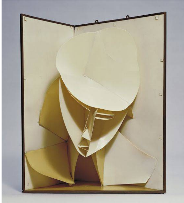
Naum Gado "Tête de femme" 1920

L'artiste utilise des feuilles de tôle pour structurer et délimiter des espaces vides.