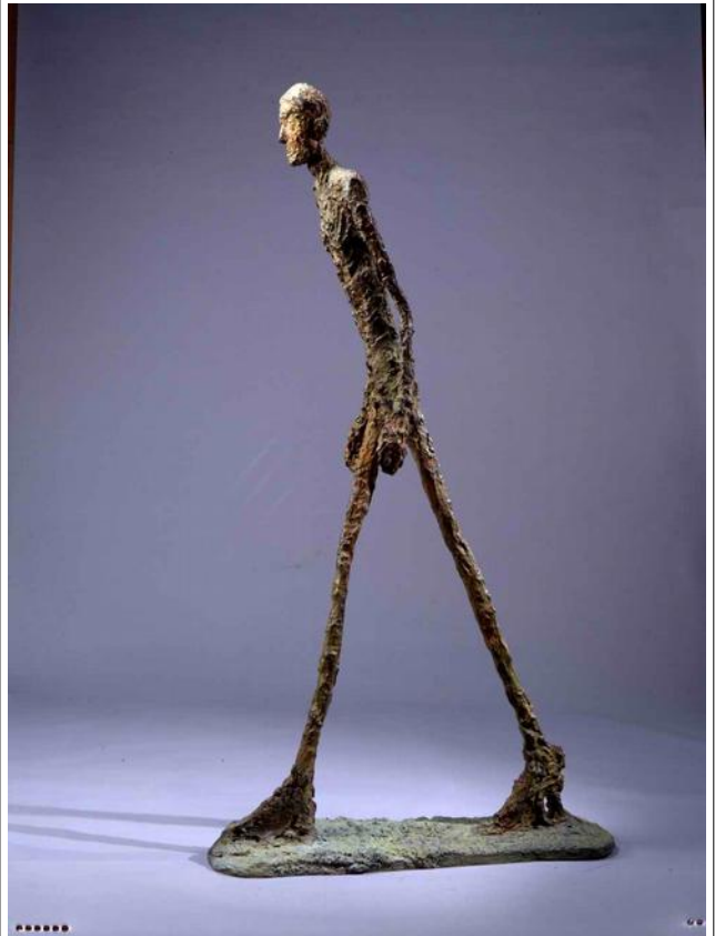
Giacometti, l'homme qui marche