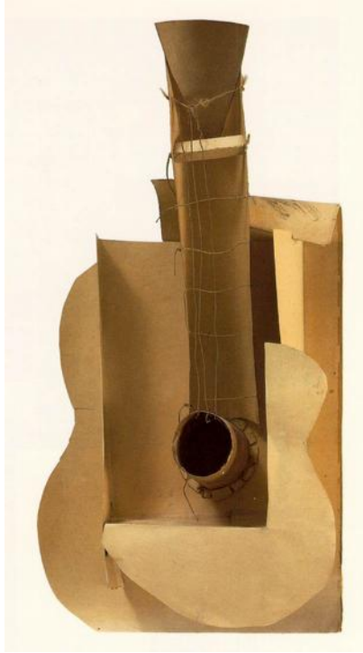
Picasso, guitare 1913