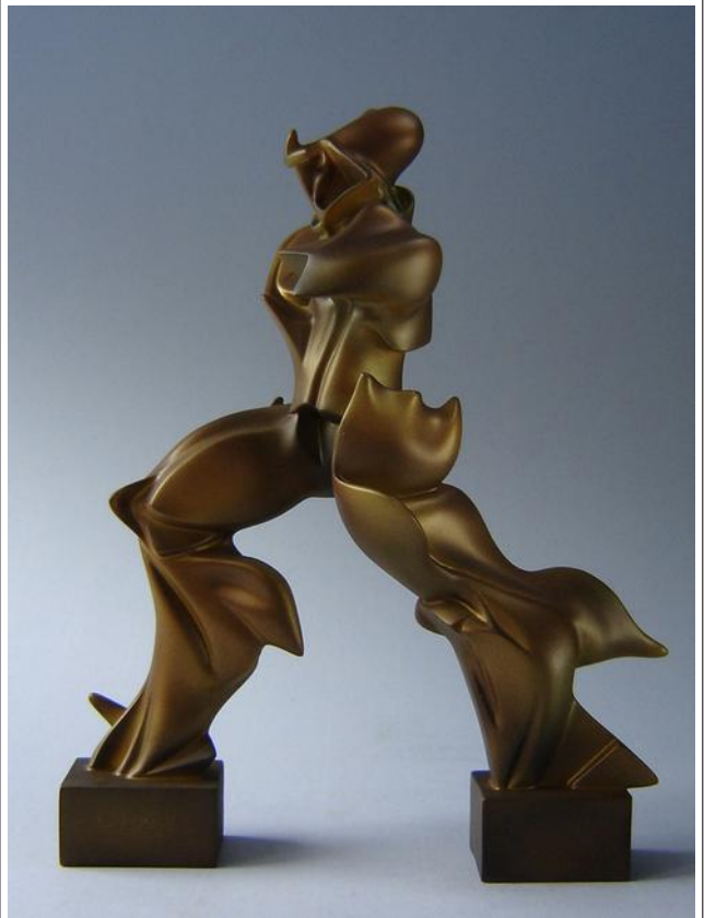
Boccioni, forme uniche de la continuità de l'espacia, 1913