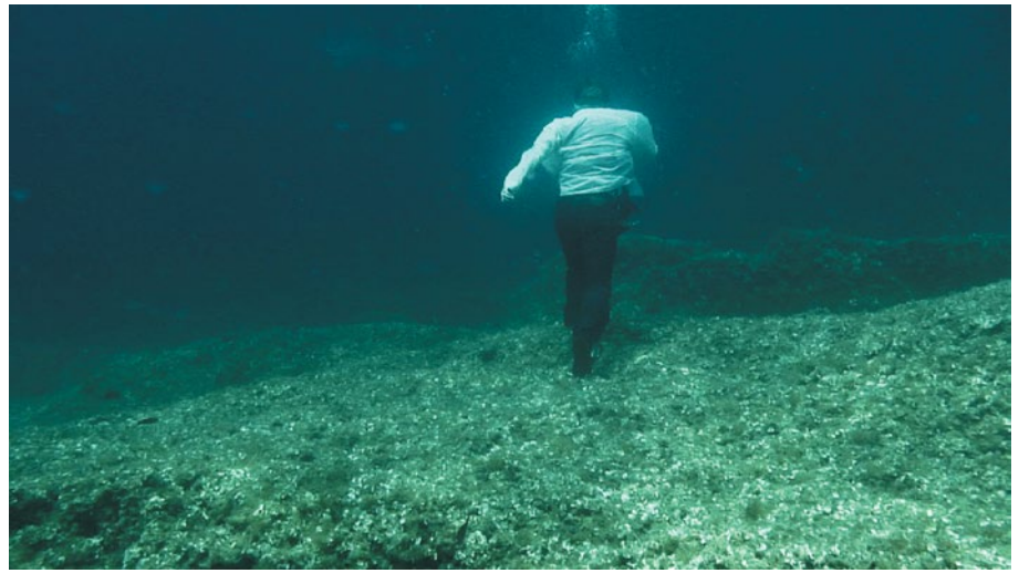
Simon Faithfull, Going Nowhere 2 , 2011 Vidéo couleur, 5'07" © Collection FRAC Normandie Caen © Simon Faithfull

réaliser sa prise de vue, inscrite dans le programme Tara Pacific, qui vise à mesurer les conséquences du réchauffement climatique. Si les coraux ont des tons pastel, ils n'en sont pas moins altérés et mous. La comparaison de ces deux œuvres offre un raccourci saisissant entre deux visions de l'océan : vierge, ou altéré par l'empreinte humaine.