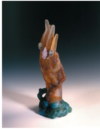
Emile Gallé, Mains aux algues et aux coquillages , 1904, Verre à plusieurs couches travaillé à chaud, regravé à froid, applications, 32,5 x 13,2 cm, Musée de l'École de Nancy