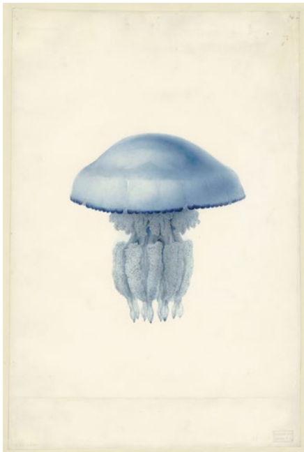
Charles-Alexandre Lesueur, Méduse, Rhizostoma octopus (Linné, 1788) (Scyphoméduse). Non datée – probablement entre 1804 et 1815, Aquarelle sur vélin, 42,3 x 28,5 cm