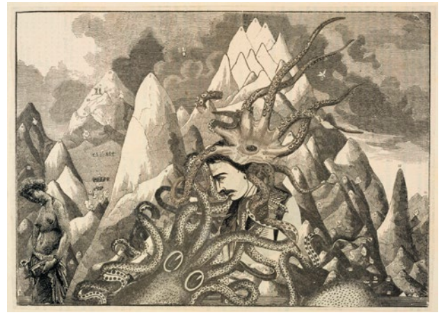
Max Ernst, Suite (a) La femme 100 têtes : Chapitre IX, planche 131 , 1929 Papier, 255 x 205 x 30 mm (fermé), Bibliothèque Sainte-Geneviève, Paris © ADAGP, Paris 2018