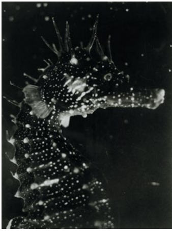
Jean Painlevé, Buste d'hippocampe , 1931 Épreuve gélatino-argentique, 141 x 98 cm, Paris, Archives Jean Painlevé