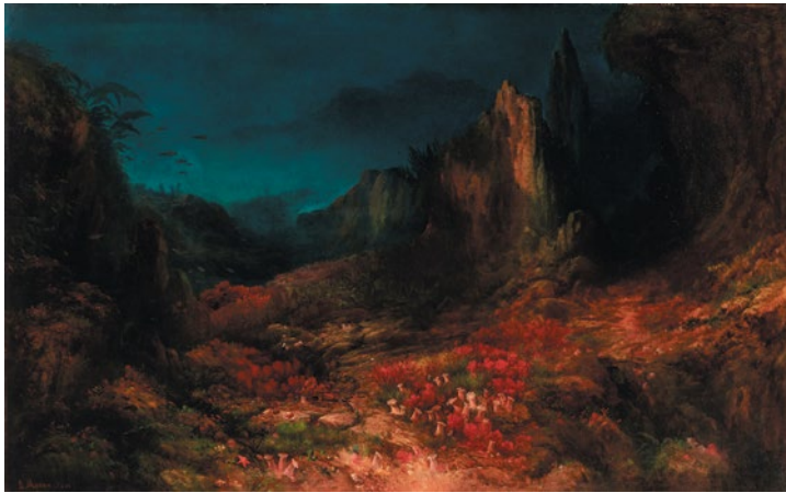
Edward Moran, The Valley in the sea , 1862 Huile sur toile, 102,9 x 162,6 cm, Indianapolis Museum of Art at Newfields, Martha Delzell Memorial Fund, 70.5.