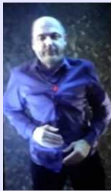
Bill Viola, Self Portrait, Submerged, 2013 https://www.youtube.com/watch?v=qaNkeqelVI4