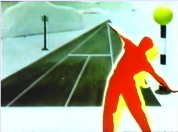
Len Lye, Rainbow dance, 1936 https://www.youtube.com/watch?v=AHN9IHGQxk8