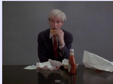
Andy Warhol eating a burger - 4'27 https://www.youtube.com/watch?v=Ejr9KBOzQPM