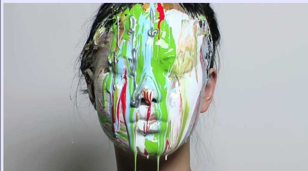
Cut Copy Lights & Music