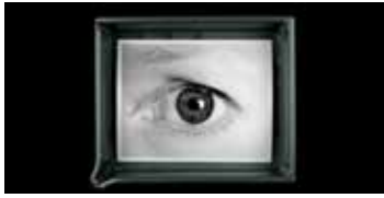
ANNE COLLIER Developing Tray #2 (Grey), 2009