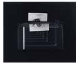
ANNE COLLIER Cut, 2009