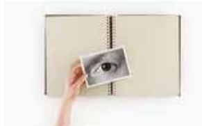
ANNE COLLIER Album (Eye) #3, 2014