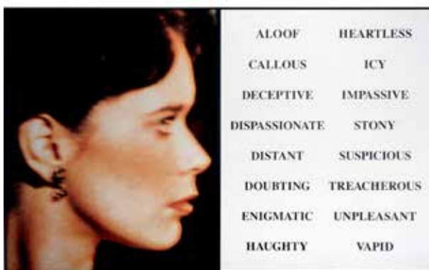
JOHN BALDESSARI Prima facie (third state) From Aloof to Vapid, 2005