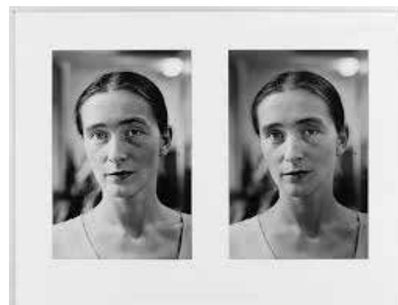
TIMM RAUTERT Pina Bausch, 1972