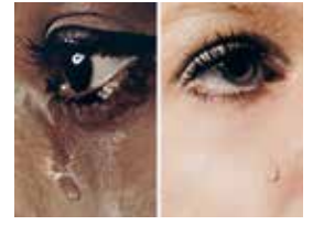
ANNE COLLIER Woman Crying #8 et #7, 2016