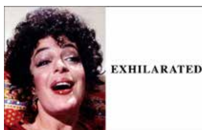
JOHN BALDESSARI Exhilarated, 2005