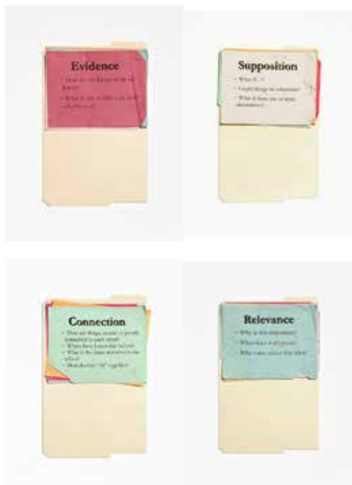
ANNE COLLIER Relevance, Supposition, Connection, Viewpoint, Evidence, 2011