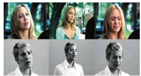
CANDICE BREITZ Becoming, 2003.