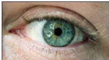
DOUGLAS GORDON Sans titre, 2000 Collection du Frac Normandie Rouen