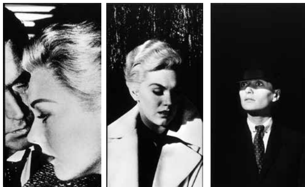
VICTOR BURGIN extrait de l'album The Bridge, 1983-1984 Collection Frac Normandie Rouen