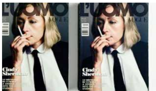
ANNE COLLIER May Jun 2009 (Cindy Sherman, Mark Seliger), 2009