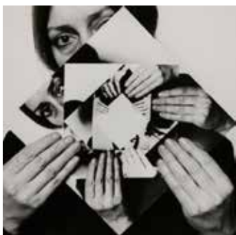
DORA MAURER Sept Rotations 1-6, 1979