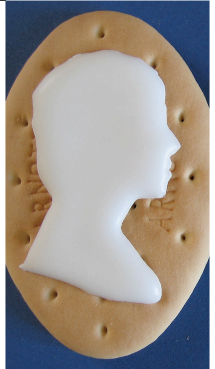
Stephanie Jones, les biscuits de Butades , sucre glace sur biscuits arnott's,