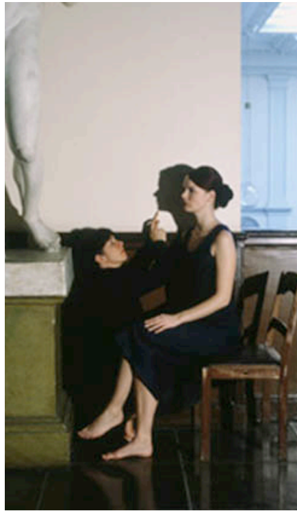
Karen Knorr, extrait de la série académie , 1994, photographie

Vous transposez cette scène éternellement rejouée: une personne souhaite garder l'image de l'être aimé, qui va s'absenter. Vous devez en proposer une image, qui fasse évidemment référence au mythe mais qui en propose aussi une version inédite: au début du XXI eme siècle, nous avons d'autres moyens qu'un fusain et la lumière du jour...Mais avons nous davantage les moyens de palier à l'absence de l'autre?