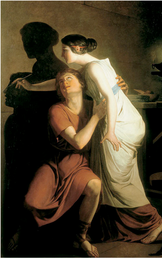
Joseph Benoît Suvée , La découverte de l'art du dessin , huile sur toile, 1791