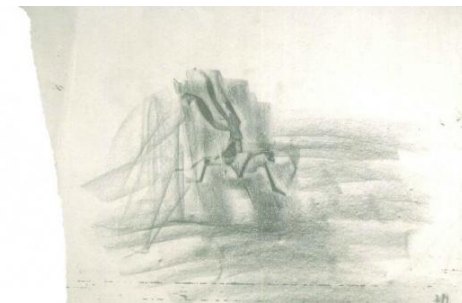
◀ Bryan Nash Gill , WoodCut , 2012