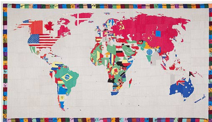
Alighiero Boetti, La carte du monde , 1984